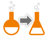
Transfert de réactifs