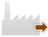
Eaux usées industrielles