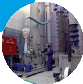
Hall Pilote de plus de 200 m 2

Diagnosics, Audits, Calculs, Essais, Tests