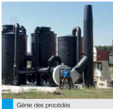
Génie des procédés