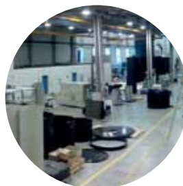
Plus de 8400 m 2 d'atelier en France